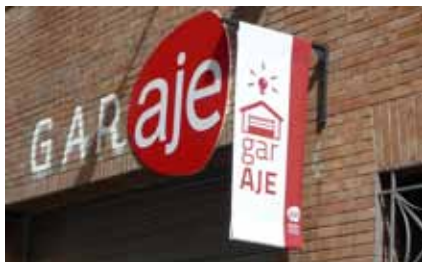
Encuentros de networking organizados por AJE.