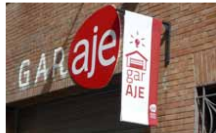
Garaje, sede de AJE en Madrid