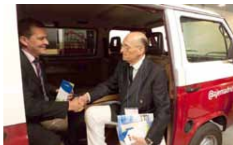
Miembros de Grupo Jenasa en la oficina móvil de AJE Madrid.