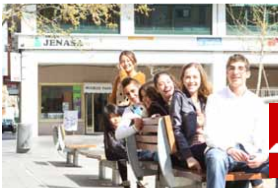
Estudiantes de los colegios Alkor y Villalkor que participaron este año en el proyecto 4º ESO EMPRESA, realizando sus prácticas en las instalaciones de GRUPO JENASA.