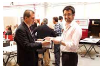
Intercambio de tarjetas y presentaciones en el II Encuentro Comercial de AJE.